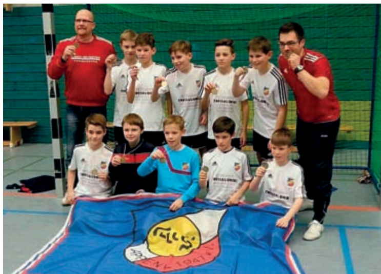
erfolgreiche 1. D-Junioren Jahrgang 2002

BADMINTON · FUSSBALL · HANDBALL JUDO · TENNIS · TISCHTENNIS · TURNEN