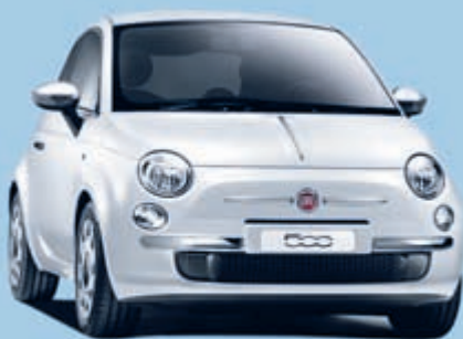
Abb. zeigt Sonderausstattung